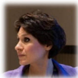
Dott.ssa ELENA BUSCEMI Presidente del Consiglio Comunale di Milano Partito Democratico