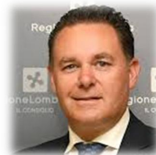
Avv. LUCA MARRELLI Consigliere Regionale Lombardia Lombardia Ideale