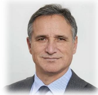
ON. LUCA SQUERI Deputato della Repubblica Italiana Forza Italia