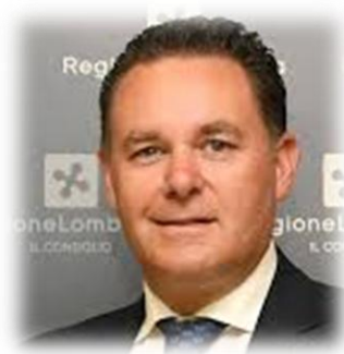
Avv. LUCA MARRELLI Consigliere Regionale Lombardia Lombardia Ideale